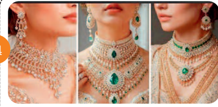
ब्राइडल लुक पूरा होगा डायमंड ज्वेलरी के साथ, लेटेस्ट डिजाइन है आपके लिए